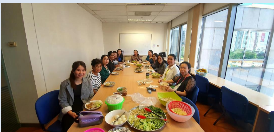
แสดงภาพจัดกิจกรรมเลี้ยงอาหารเนื่องในโอกาสต่างๆ