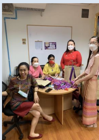
ภาพแสดงความร่วมมือแรงร่วมใจของบุคลากรในการจัดกิจกรรมต่างๆ