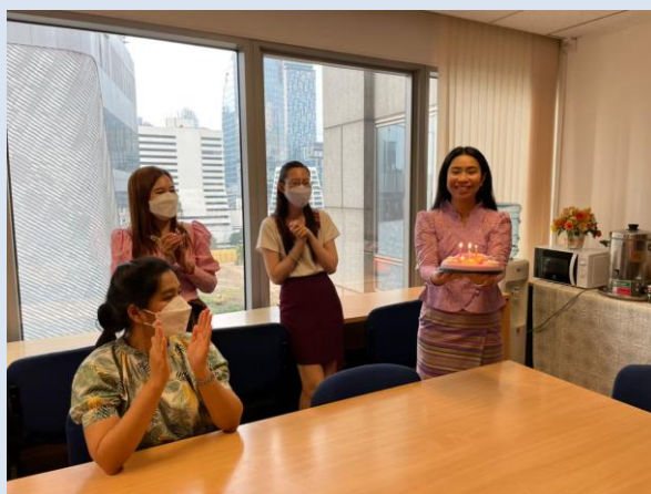
แสดงภาพการมอบเค้กเนื่องในวันคล้ายวันเกิดของบุคลากร