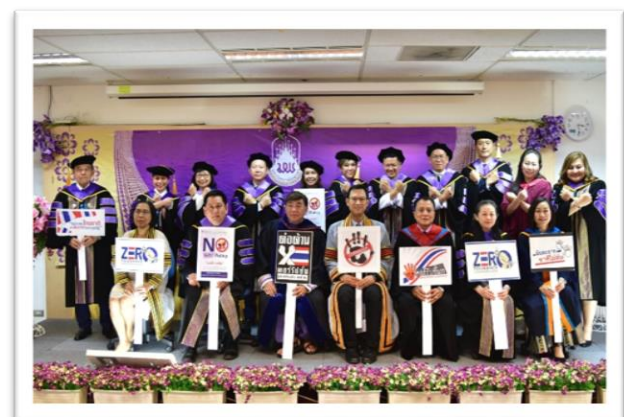
ภาพที่ 2 คณาจารย์และนิสิต วิทยาลัยการจัดการ ร่วมกัน ตอบสนองนโยบายและเจตนารมณ์ ไม่ให้ ไม่รับ ของขวัญและของ กำนัลทุกชนิดจากการปฏิบัติหน้าที่ (No Gift Policy) ประจำปีงบประมาณ 2566