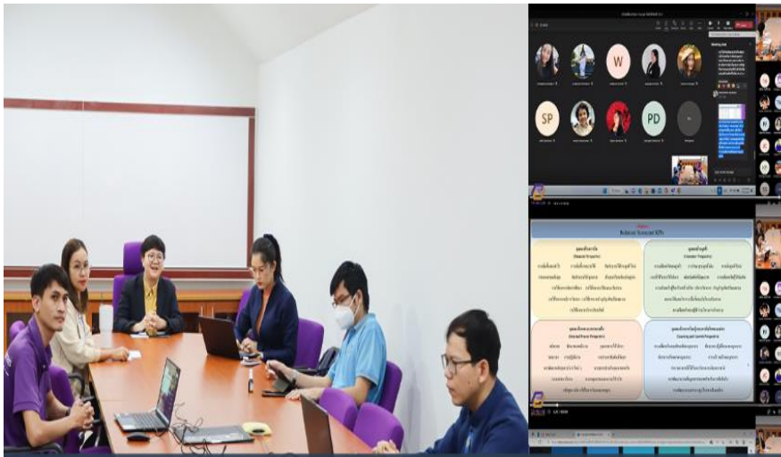
งานแผนงาน วิทยาลัยการจัดการ เข้าร่วมประชุมชี้แจงกระบวนการดำเนินงานผ่านระบบบริหารจัดการแผนและงบประมาณ (e-Budget) ผ่านระบบ Microsoft Teams