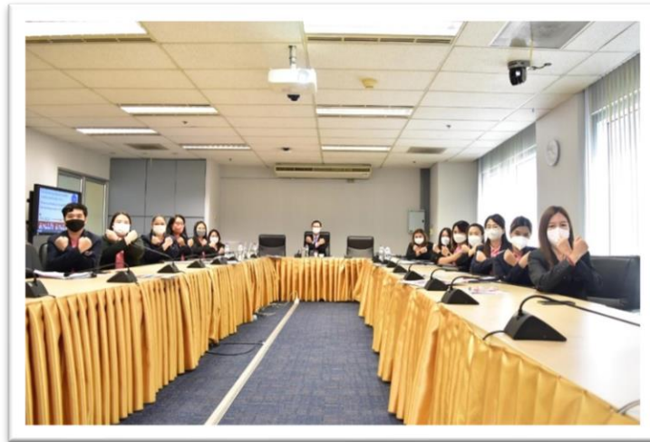
ภาพที่ 2 ผู้บริหาร บุคลากร แสดงออกเชิงสัญลักษณ์ต่อการทูลจรีตอรรีบั้ง ณ ห้องประชุม L807 ชั้น 8 วิทยาลัยการจัดการ มหาวิทยาลัยพะเยา เมื่อวันที่ 16 มกราคม 2566