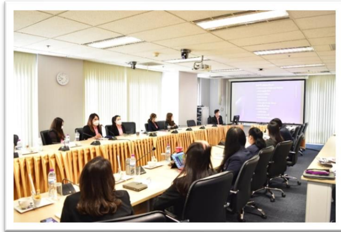
ภาพที่ 2 บุคลากรวิทยาลัยการจัดการร่วมประชุม ในกำหนดแผนงานการดำเนินโครงการยกระดับคุณธรรมและความโปร่งใสในการดำเนินงานของวิทยาลัยการจัดการ (ITA)