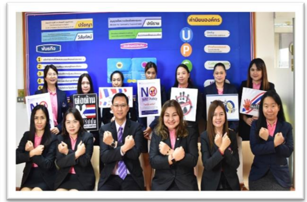
ภาพที่ 1 ผู้บริหารและบุคลากรตอบสนองนโยบายและเจตนารมณ์ ไม่ให้ ไม่รับ ของขวัญและของกำนัลทุกชนิดจากการปฏิบัติ หน้าที่ (No Gift Policy) ประจำปีงบประมาณ 2566