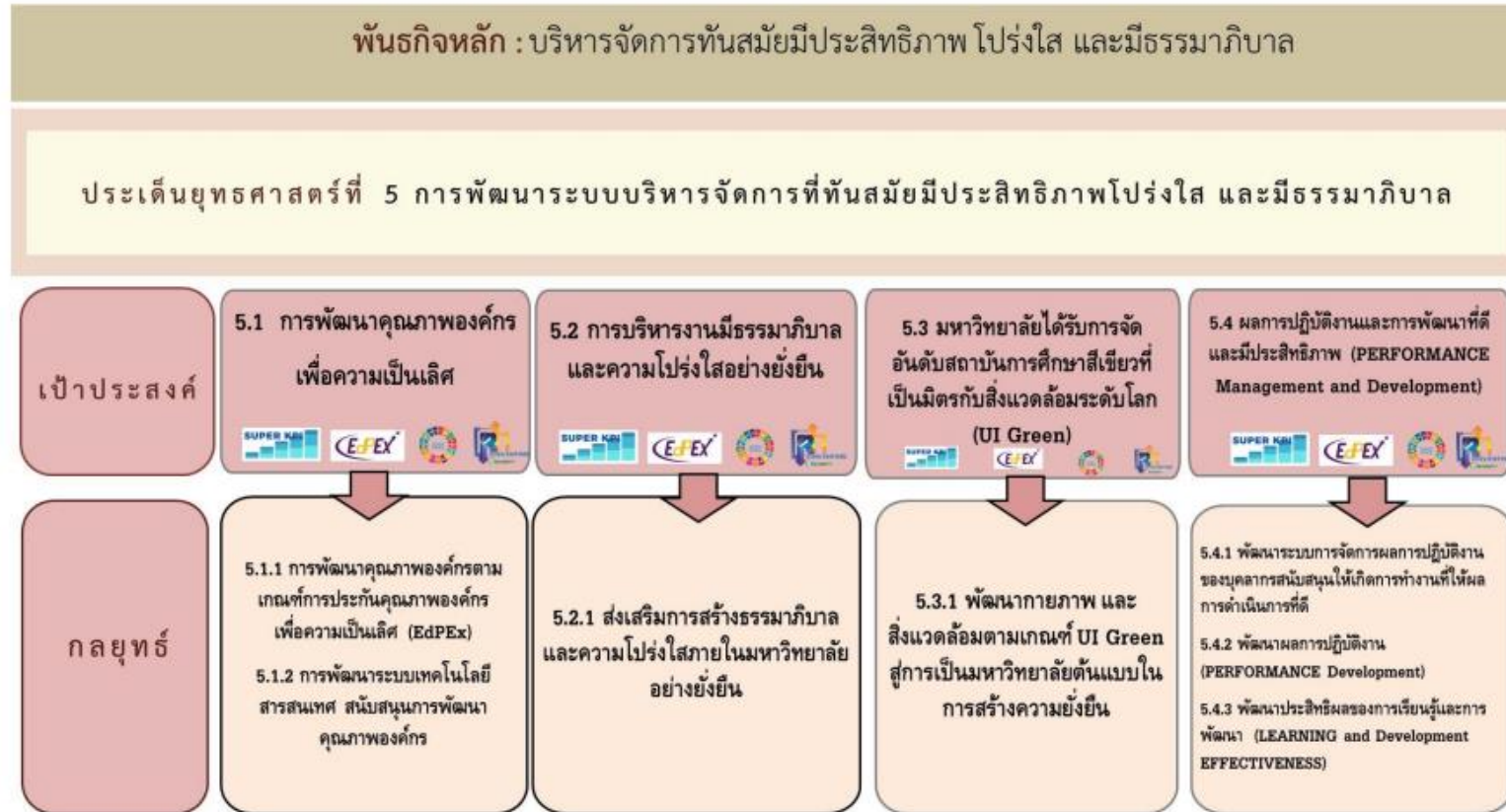
รูปที่ 2.12 ความเชื่อมโยงของพันธกิจและประเด็นยุทธศาสตร์ด้านบริหารจัดการทันสมัยมีประสิทธิภาพ โปร่งใส และมีธรรมาภิบาล

ที่เกี่ยวข้องกับการดำเนินการป้องกันและปราบปรามการทุจริตของวิทยาลัยการจัดการ มหาวิทยาลัยพะเยา