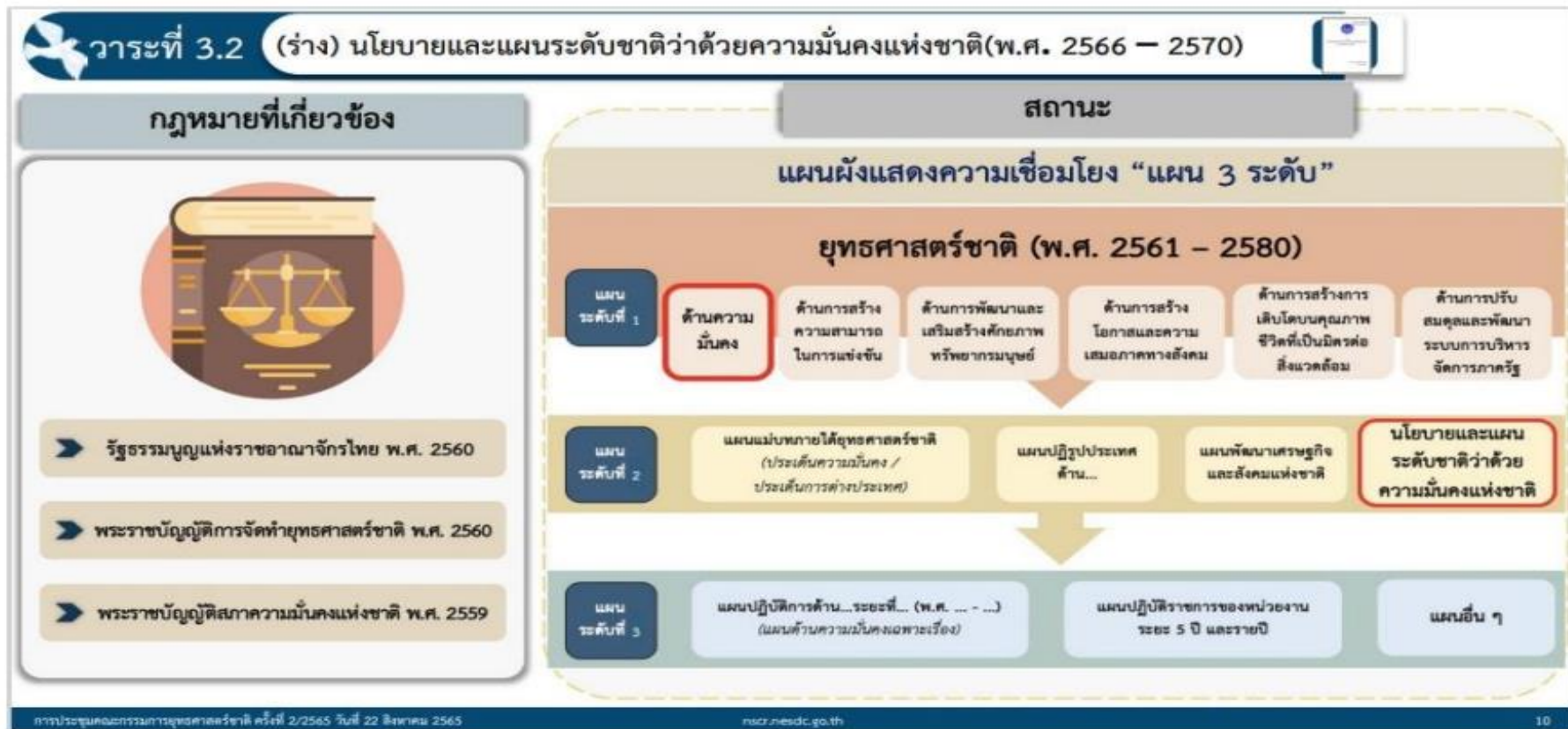
รูปที่ 2.4 ความเชื่อมโยงของแผนยุทธศาสตร์ชาติและแผนระดับต่าง ๆ ที่เกี่ยวข้อง