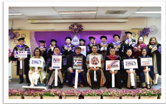
ภาพที่ 1 ผู้บริหารและบุคลากรตอบสนองนโยบายและเจตนารมณ์ ไม่ให้ ไม่รับ ของขวัญและของกำนัลทุกชนิดจากการ ปฏิบัติหน้าที่ (No Gift Policy) ประจำปีงบประมาณ 2566