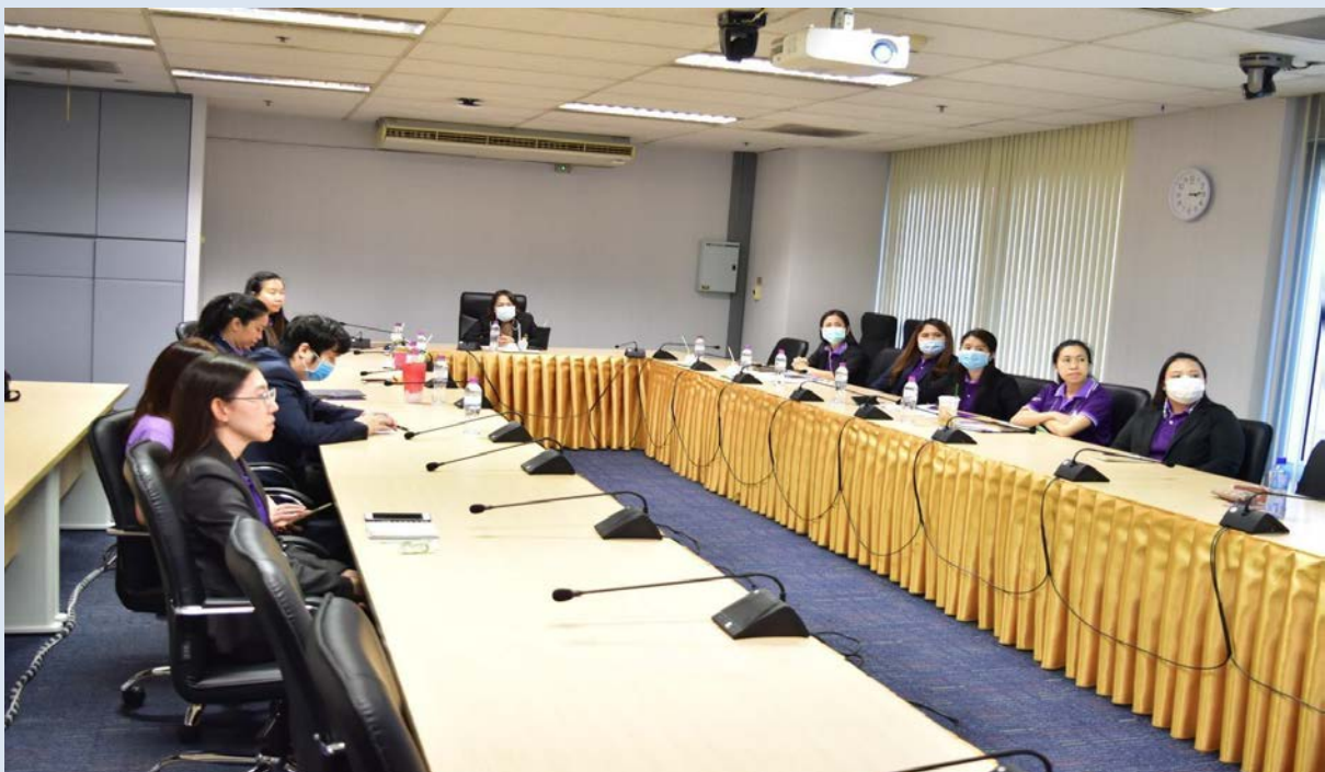
แสดงภาพจัดกิจกรรมแลกเปลี่ยนเรียนรู้ (KM) ในหัวข้อการตรวจการเปิดเผยข้อมูลสาธารณะ ของหน่วยงาน OIT ให้บุคลากรวิทยาลัยการจัดการ วันที่ 31 มกราคม 2564 ณ ห้องประชุม L807 เวลา 15.00 – 17.00 น.

จัดทำโดย ดร.เพ็ญพิมพ์ พวงสุวรรณ หัวหน้างานแผนงาน