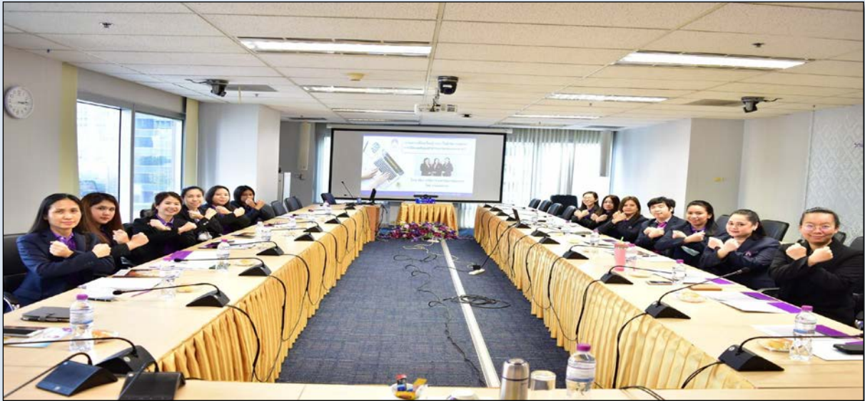
แสดงภาพจัดกิจกรรมแลกเปลี่ยนเรียนรู้ (KM) ในหัวข้อการตรวจการเปิดเผยข้อมูลสาธารณะของหน่วยงาน OIT ให้บุคลากรวิทยาลัยการจัดการ วันที่ 31 มกราคม 2564 ณ ห้องประชุม L807 เวลา 15.00 – 17.00 น.