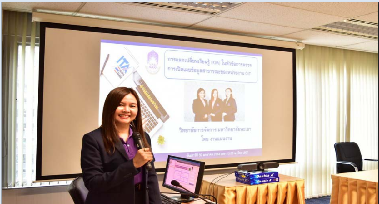
แสดงภาพจัดกิจกรรมแลกเปลี่ยนเรียนรู้ (KM) ในหัวข้อการตรวจการเปิดเผยข้อมูลสาธารณะของหน่วยงาน OIT ให้บุคลากรวิทยาลัยการจัดการ วันที่ 31 มกราคม 2564 ณ ห้องประชุม L807 เวลา 15.00 – 17.00 น.

จัดทำโดย ดร.เพ็ญพิมพ์ พวงสุวรรณ หัวหน้างานแผนงาน