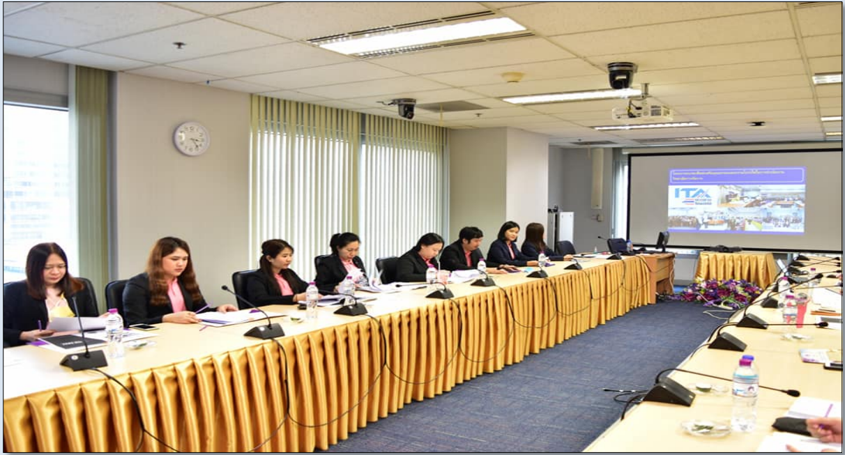
แสดงภาพ การอบรมให้ความรู้และการแบ่งงานผู้รับผิดชอบตามแบบ OIT ในโครงการอบรมเพื่อส่งเสริมคุณธรรมและความโปร่งใส เมื่อวันที่ 23 มกราคม 2564 ณ ห้องประชุม L807 เวลา 15.00 – 17.00 น.