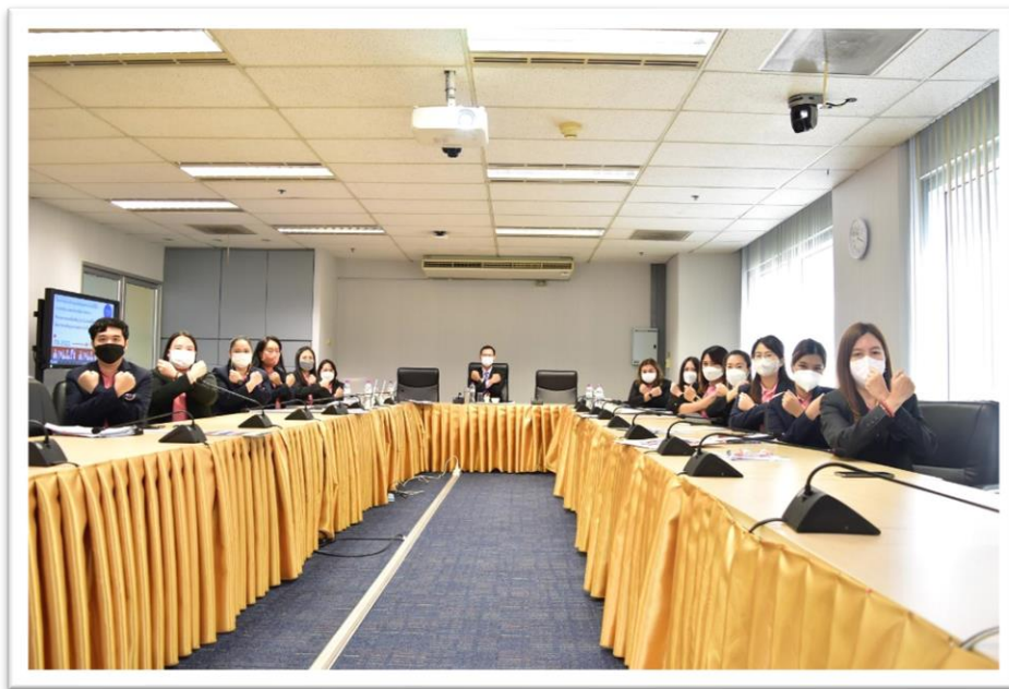
ภาพที่ 3 ผู้บริหาร บุคลากร แสดงออกเชิงสัญลักษณ์ต่อต้านการทุจริตคอร์รัปชัน ณ ห้องประชุม L807 ชั้น 8 วิทยาลัยการจัดการ มหาวิทยาลัยพะเยา เมื่อวันที่ 16 มกราคม 2566